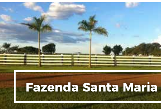
Fazenda Santa Maria da Amazônia