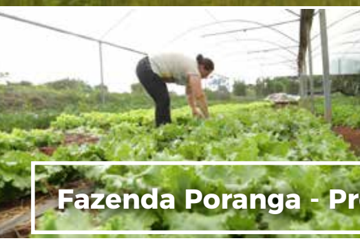
Fazenda Poranga - Projeto social